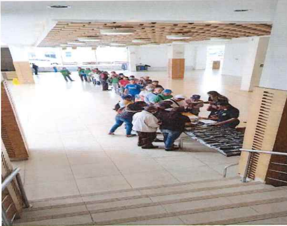
Actividad Lotero Popayán Diciembre 2022