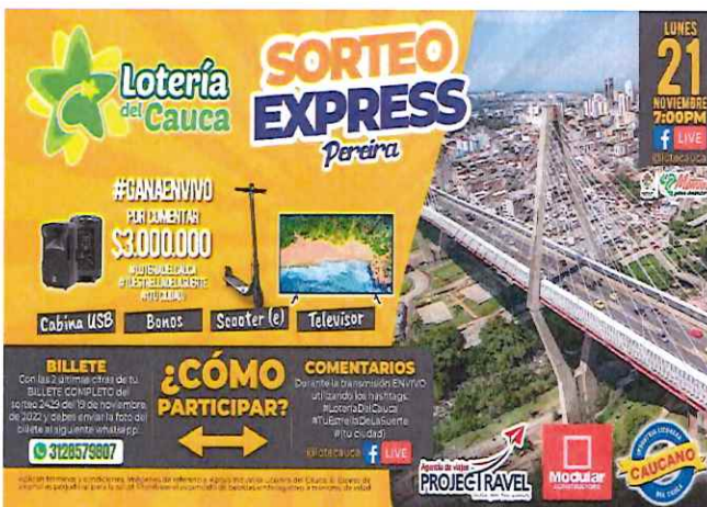
Publicidad Sorteo Express Pereira noviembre de 2022