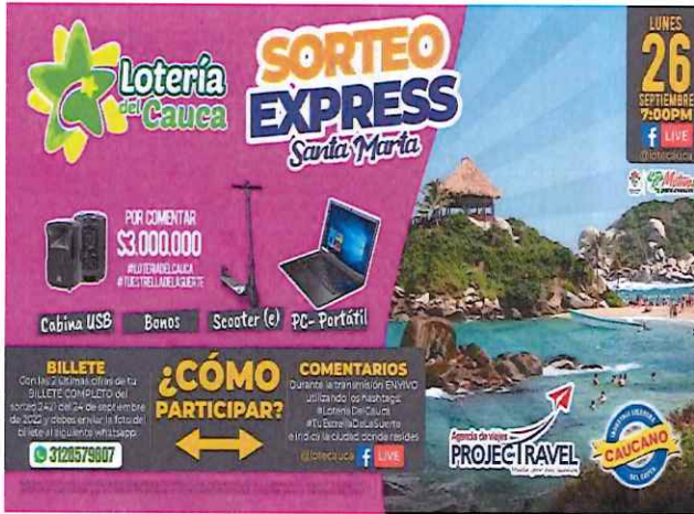
Publicidad Sorteo Express Santa Marta Septiembre 2022