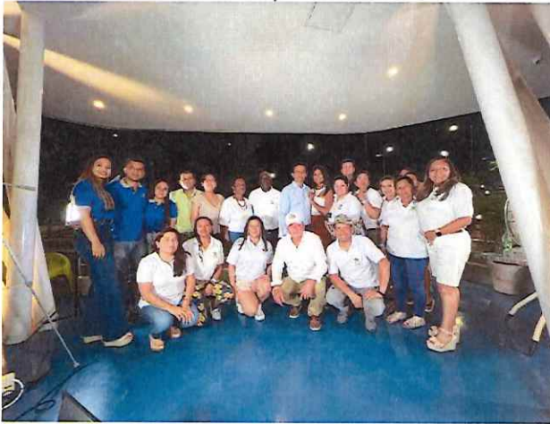
Sorteo Express Santa Marta Septiembre 2022